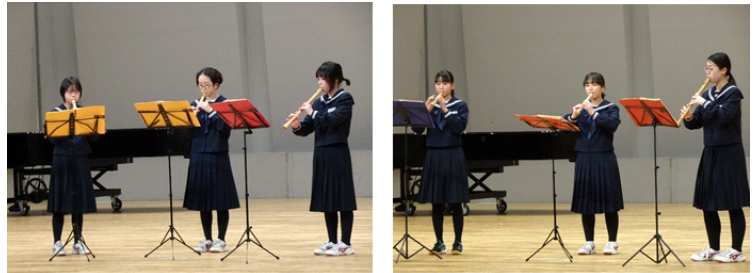
【1/14 リコーダーフェスティバルの様子】

リコーダー部は、1月14日（土）に佐和田の「アミューズメント佐渡」で行われた「第37回佐渡地区リコーダーフェスティバル」に参加しました。1年生の3人は「ナイティンゲールⅠ」、2・3年生は「ディバージョンズよりⅠ,Ⅲ,Ⅳ」を演奏しました。今年は、有観客で行われ、温かい雰囲気の中、真野中学校リコーダー部は素晴らしい演奏を披露しました。現在、3月26日（日）に開催予定の「全国リコーダーコンテスト」に向けて、毎週火・水曜日の練習をがんばっています。応援をよろしくお願いいたします。