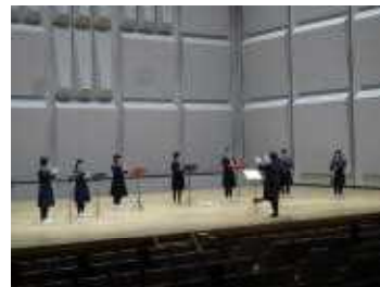
【1/15 リコーダーフェスティバル】